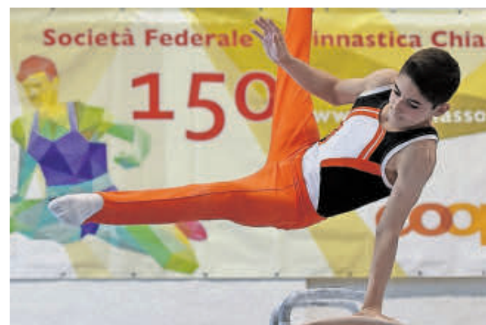
Le gare devono attendere.

Il comitato della SFG Chiasso ha invece optato per due ti-